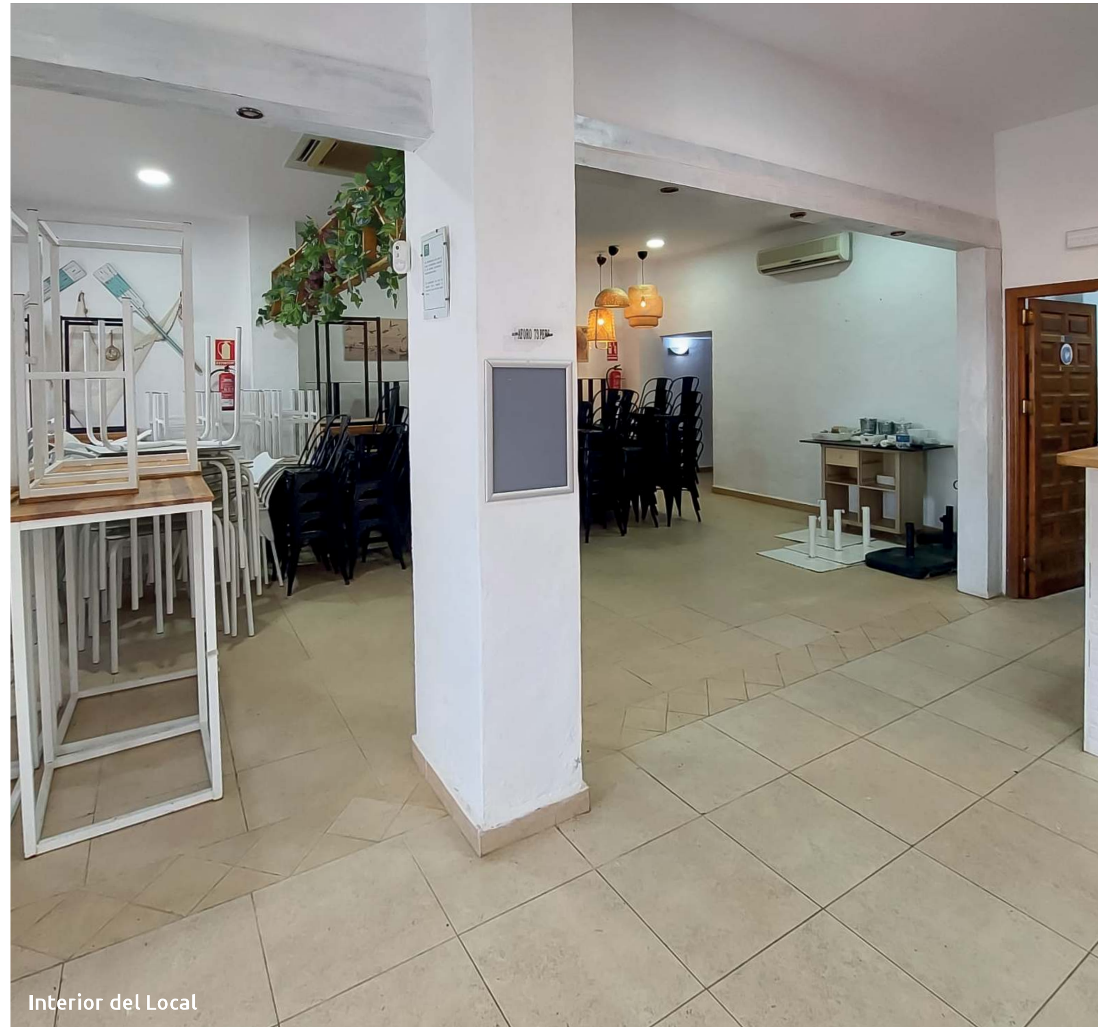
Interior del Local