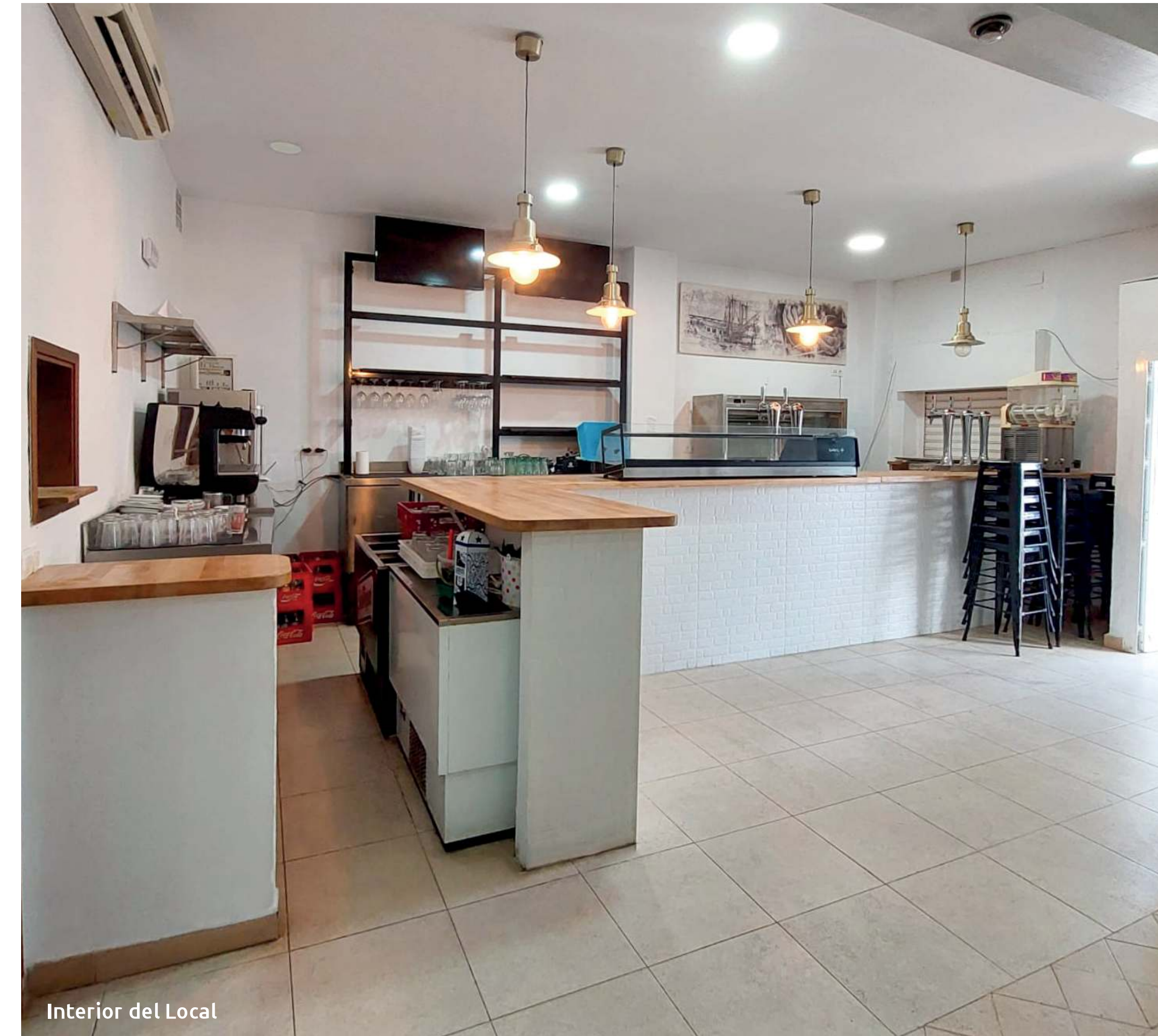
Interior del Local