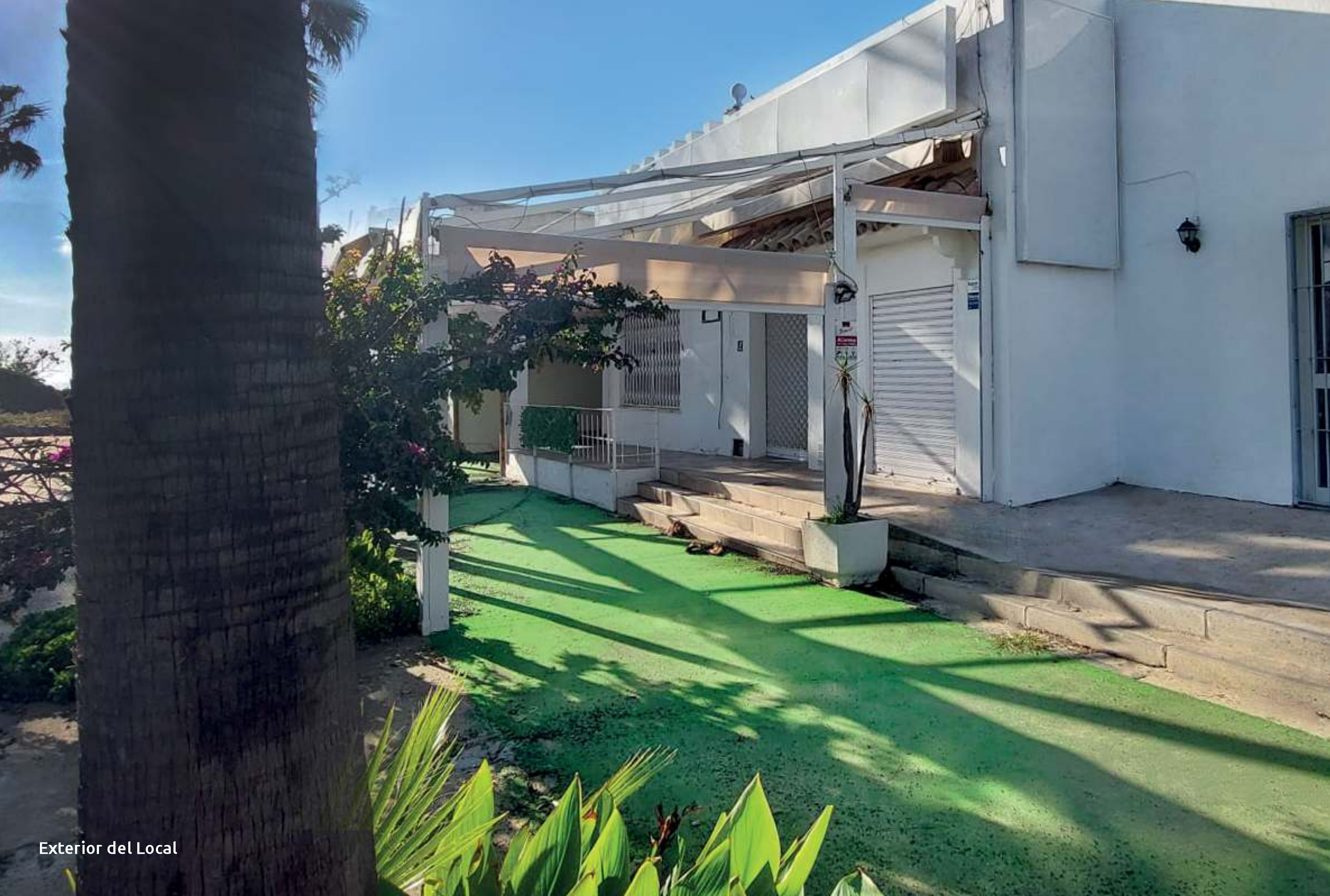
Exterior del Local