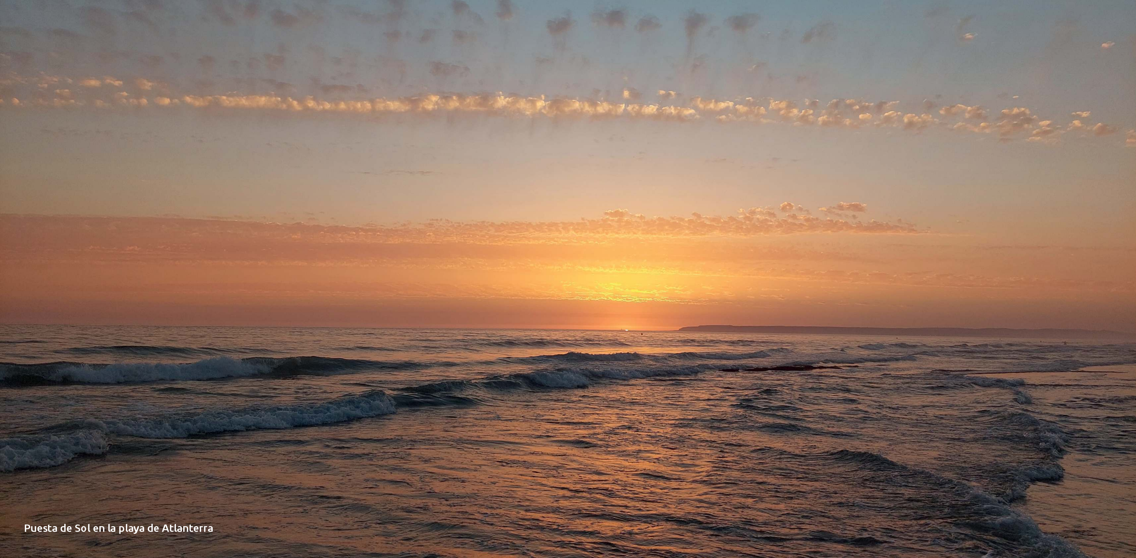
Puesta de Sol en la playa de Atlanterra