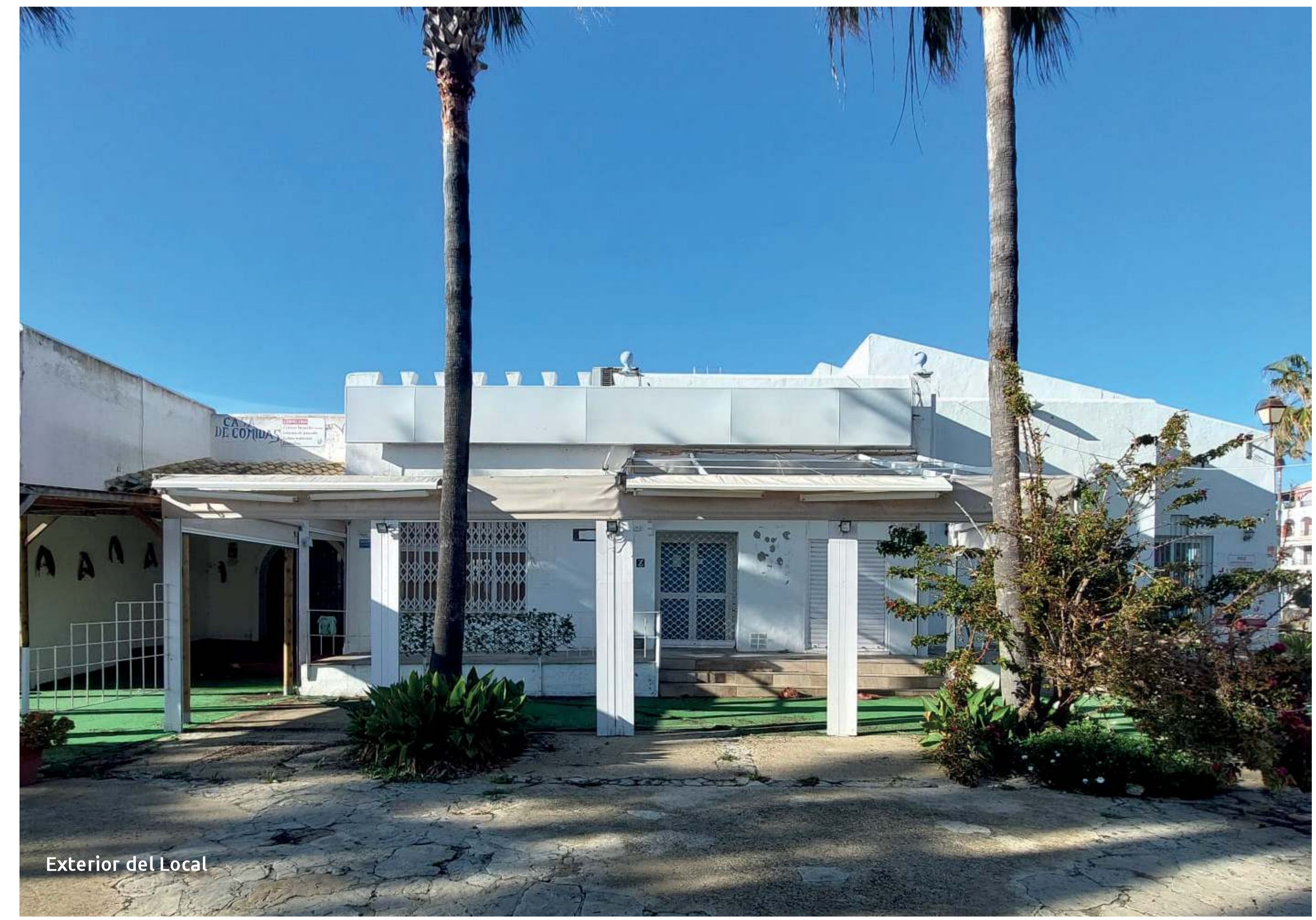
Exterior del Local