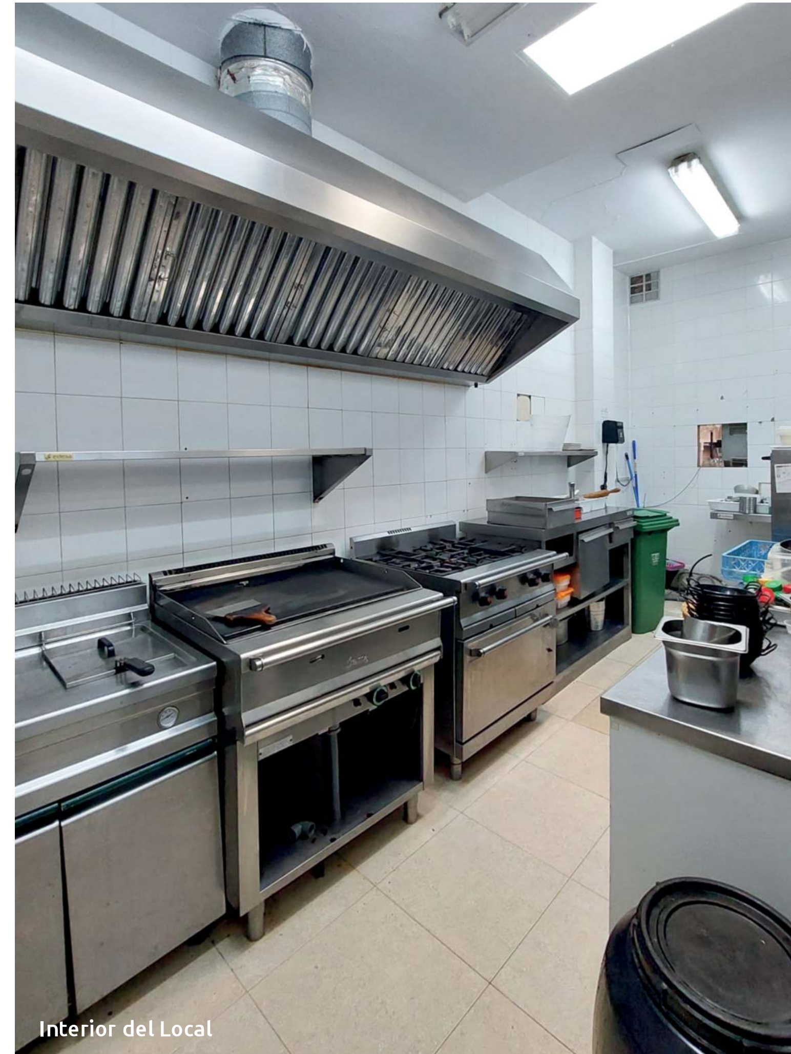
Interior del Local